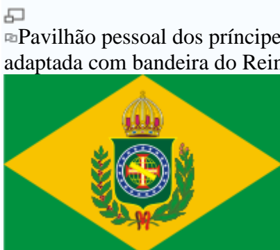
▣ Pavilhão pessoal dos príncipes reais do Reino Unido de Portugal, Brasil e Algarves, adaptada com bandeira do Reino do Brasil de setembro a dezembro de 1822.