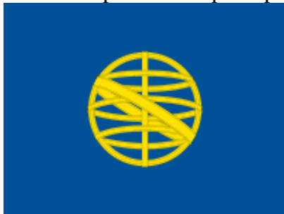
▣ Bandeira do Reino do Brasil.